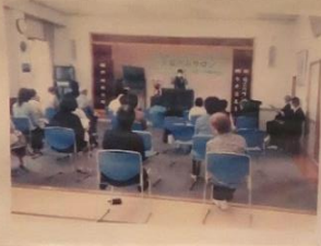
(第1回) お茶のみサロン 6月12日(日)

イベント内容 高齢者交遊会等 東北交遊による 「電話でお金詐欺」(特殊詐欺)対策 高齢者の交通安全防止対策 の講演