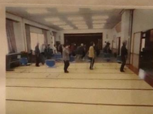
履修サロンの「よってっ亭」