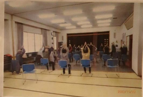
履修サロンの「よってっ亭」

第3木曜日 小島公民館において、 はつらつ体操・脳トレ・おやき販売等 を12回予定し11回開催 参加者総数、延べ380名