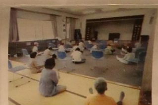
履修サロンの「よってっ亭」

小島区「敬老会」は9月19日(月)に開催予定をしていましたが、コロナの感染拡大のため中止となりました。